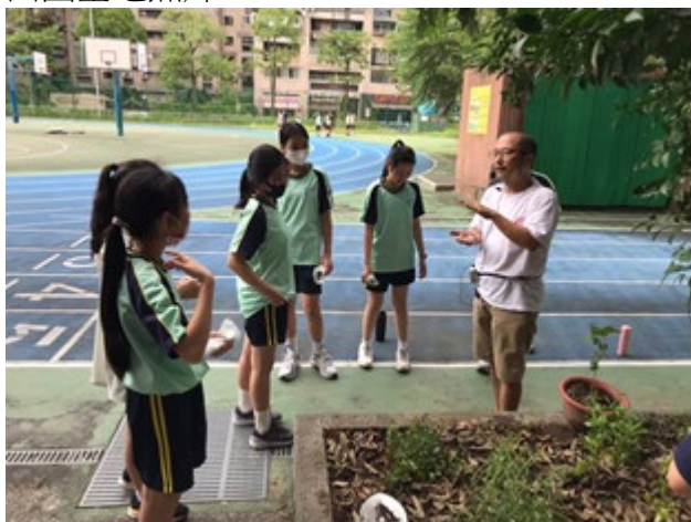
田園基地照片說明 6：側門花圃：「側門小田園整理」課程。