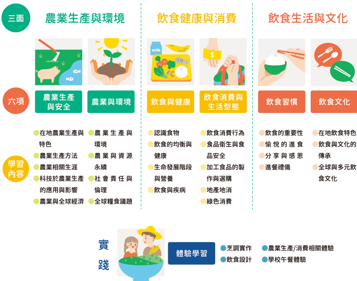
圖1 食農教育 ABC 模式：食農教育三面六項

資料來源：林如萍，食農教育之推展策略（一）：學校教育實施之概念架構分析，106年度國立臺灣師範大學產學合作計畫研究報告，頁28。