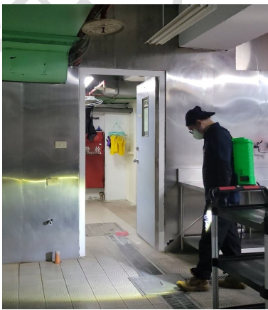
照片說明：使用高壓動力式噴霧機針對地板進行噴藥 拍攝日期：115年02月13日