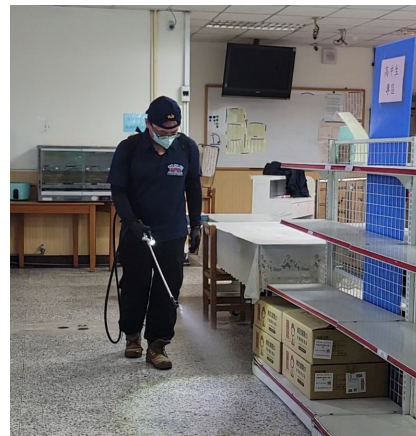
照片說明：使用高壓動力式噴霧機針對地板進行噴藥 拍攝日期：115年02月13日