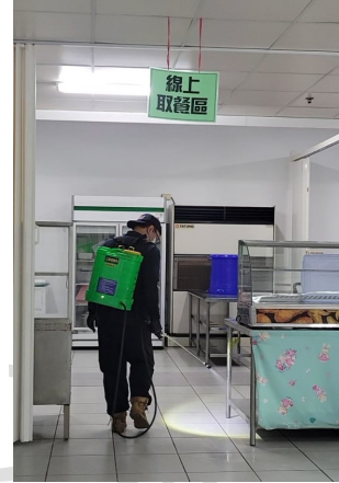
照片說明：使用高壓動力式噴霧機針對地板進行噴藥 拍攝日期：115年02月13日