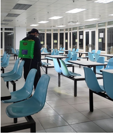
照片說明：使用高壓動力式噴霧機針對地板進行噴藥 拍攝日期：115年02月13日