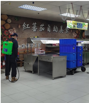
照片說明：使用高壓動力式噴霧機針對地板進行噴藥 拍攝日期：115年02月13日