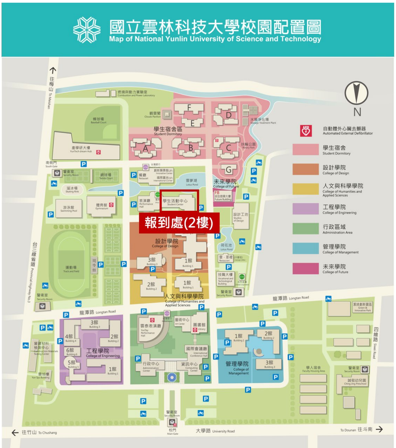
〔圖1〕報到地點路線圖

請參賽隊伍備妥 學生證 於12月6日(星期六)上午9時至9時30分一同完成報到，報到地點於本校活動中心2樓(圖1)。