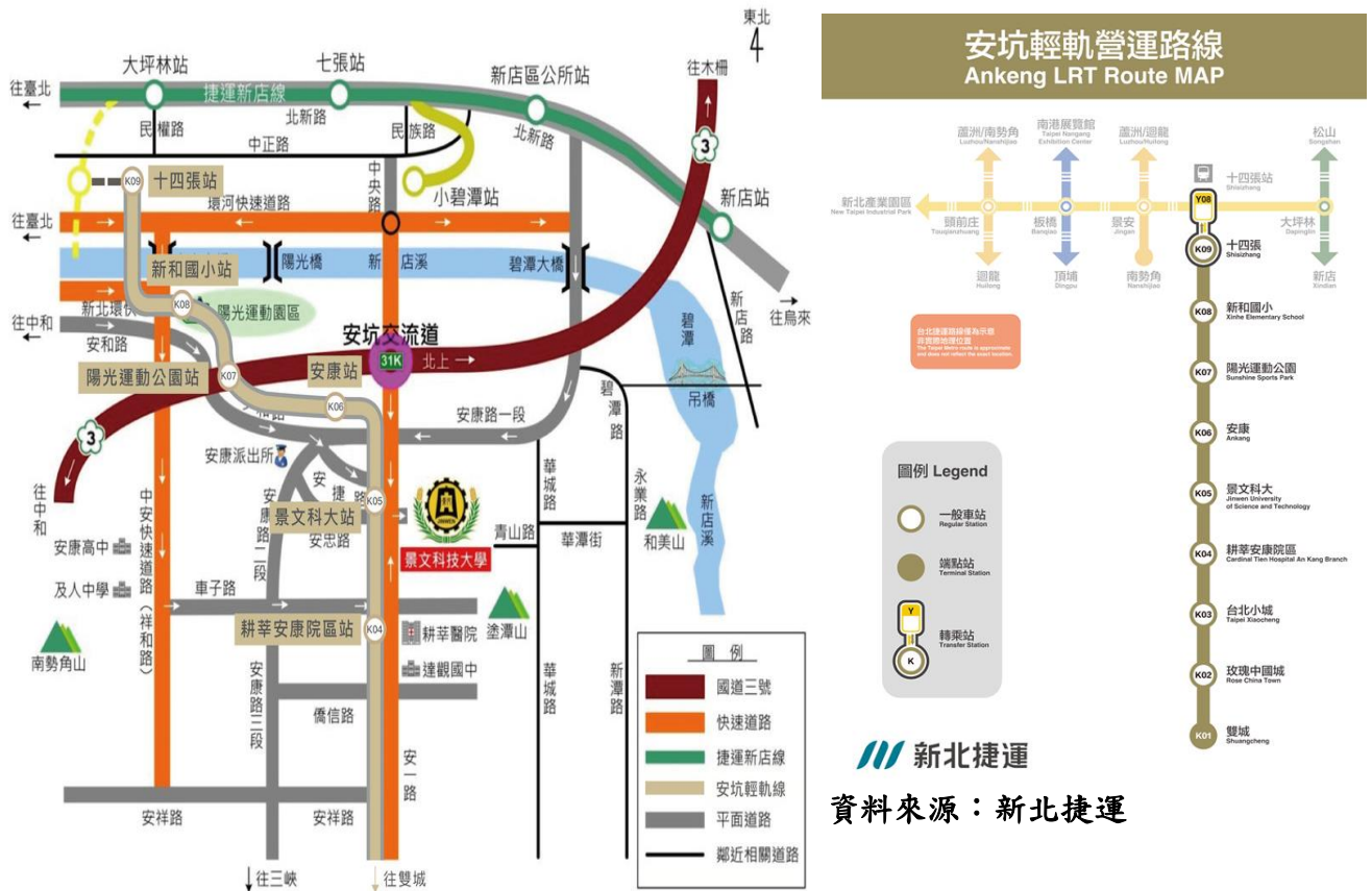
新北捷運