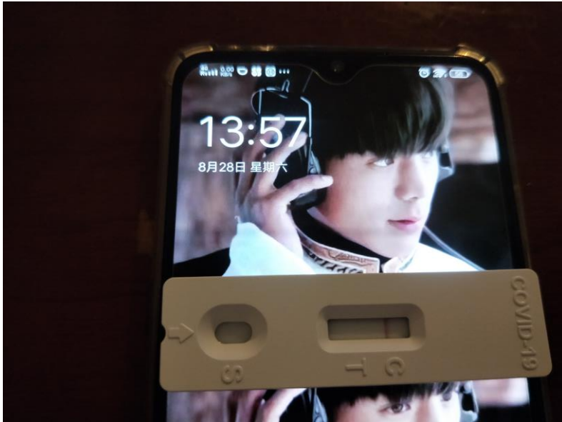
範例 1：檢查結果與另一隻手機日期時間合拍