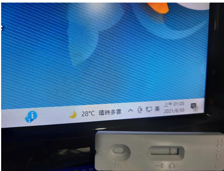
範例 2：檢查結果與電腦右下角日期時間合拍